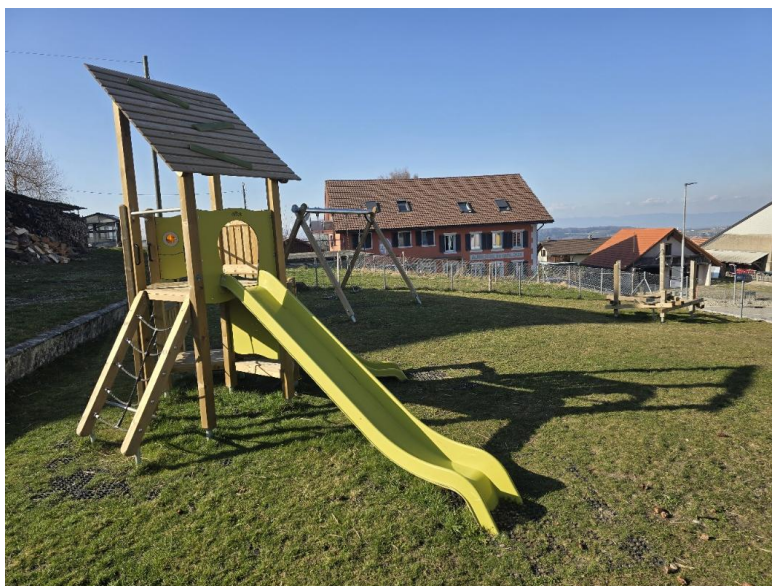
Montant voté : CHF 70'000.- Coûts finaux du projet : CHF 69'993.65