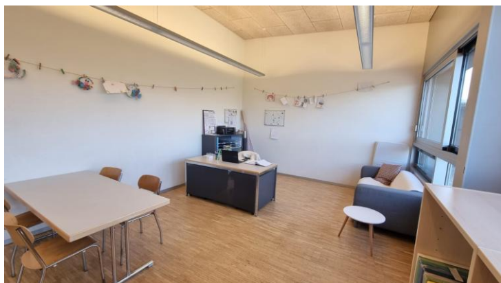
Montant voté : CHF 30'000.- Coûts finaux du projet : CHF 28'597.90